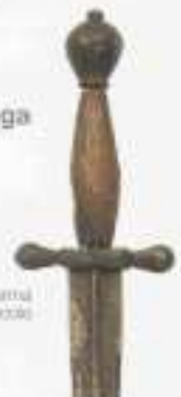
impugnatura arma 16°-17° secolo