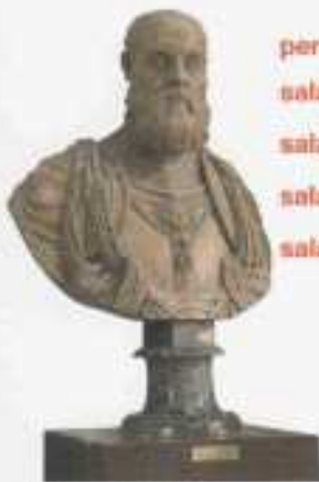
Busto Ferrante Gonzaga