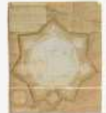
mosaico della città di Quindici