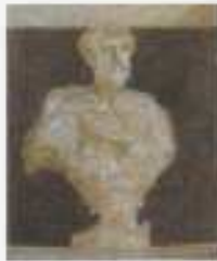
Lelio Orsi, busto di guerrieri