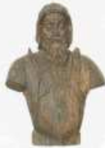
Lelio Gonzaga scultore ferrarese