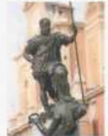
statua di Ferrante Gonzaga