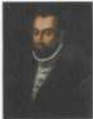
ritratto di Cesare I Gonzaga