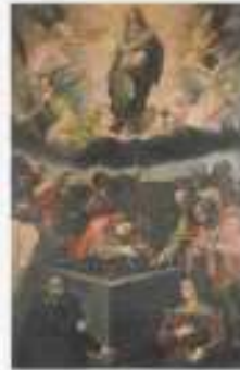
palazzo della Giove