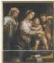
Madonna della coltina