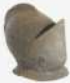
elmo da cavale 16° sec.