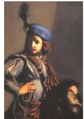
(Guido Cagnacci, "David con la testa di Golia", olio su tela, metà '600, collezione privata)

Guido CAGNACCI Protagonista del Seicento tra Caravaggio e Reni