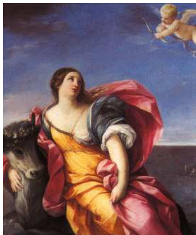
(Guido Reni, "il ratto di Europa", olio su tela, 1636/37, collezione Sir Denis Mahon)

il corpo. Alla sua indole inquieta, alla mescolanza di passione e spiritualità, al fatto di essere stato alla scuola di molti senza divenire mai discepolo di alcuno si devono i capolavori che si collocano fra il naturalismo drammatico di Caravaggio e la bellezza virtuosa di Guido Reni.