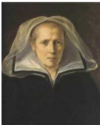
(Guido Reni, "Ritratto di vedova (ritratto della madre)", olio su tela, 1615 circa)

Accompagnati da una guida abbiamo visitato la mostra che, oltre alle opere del Cagnacci, conteneva anche confronti clamorosi (Caravaggio, Gentileschi, Guido Reni, Vouet, Guercino). Ci è stato dimostrato che chi ha dipinto la Cleopatra di Vienna e Giacobbe fra Lia e Rachele di Hampton Court non è inferiore a quei grandi ma si misura con loro alla pari, in un rapporto di appassionata competizione.