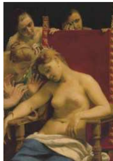
(Guido Cagnacci, "La morte di Cleopatra", olio su tela, 1660-61 circa)

sono stati dirottati verso altre iniziative.