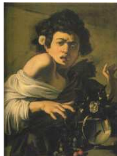
(Michelangelo Merisi, detto il Caravaggio, "Ragazzo morso da un ramarro", olio su tela, 1593-94 circa)

"GUIDO CAGNACCI Protagonista del Seicento tra Caravaggio e Reni è il titolo della mostra che con più di 80 opere costituisce la più grande monografia nazionale dedicata al pittore romagnolo.